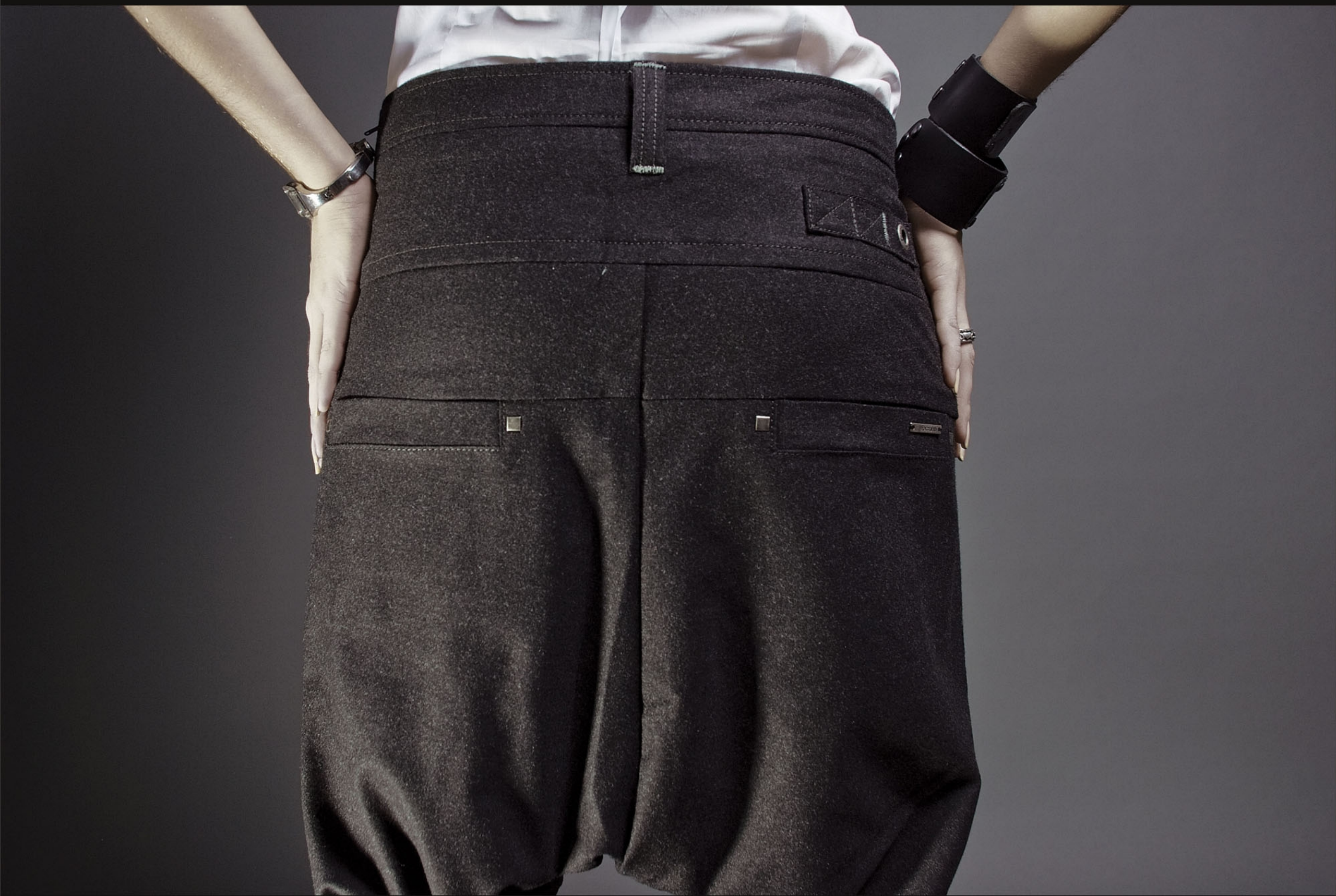
Брюки "Meds" Tapered Fit