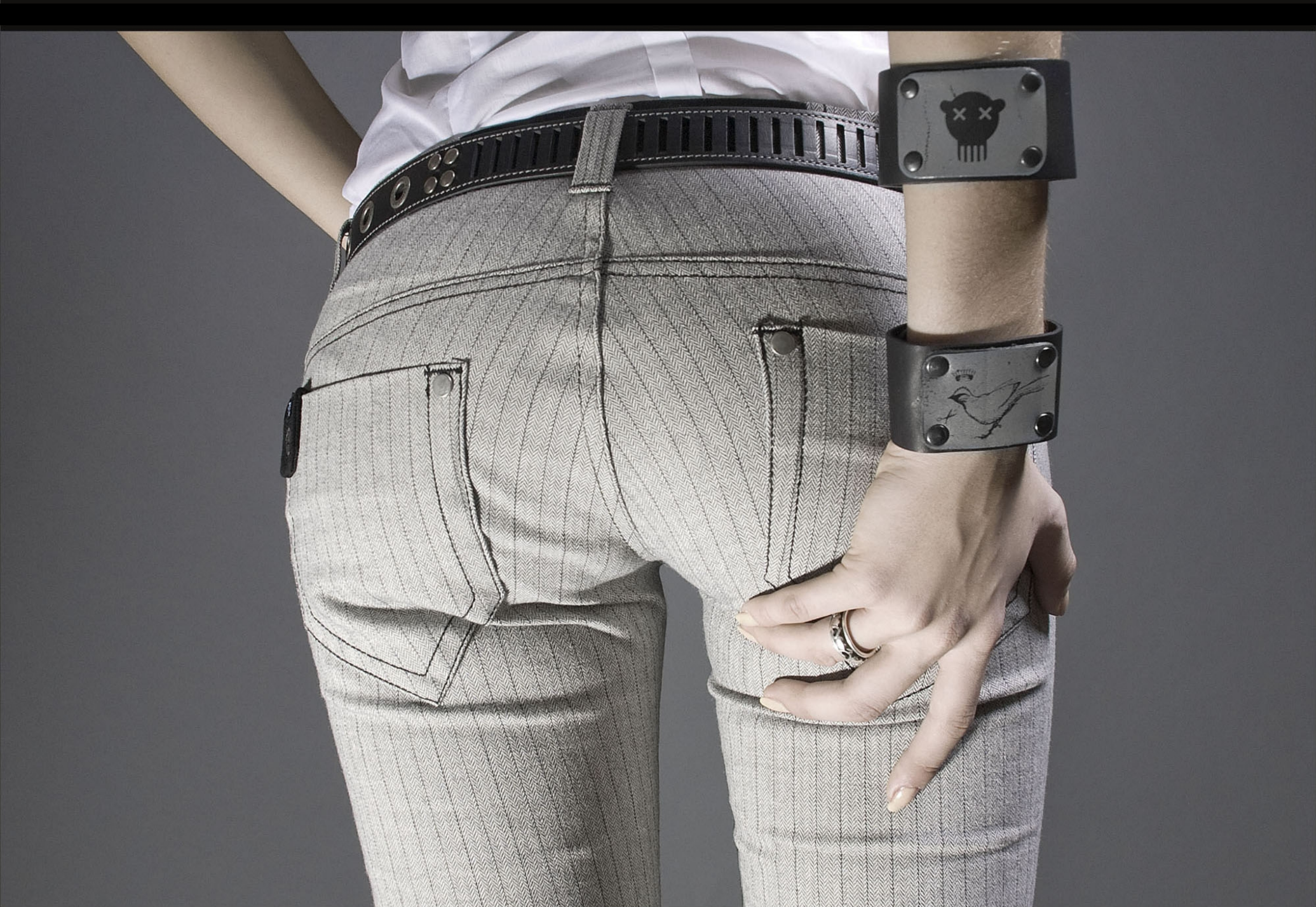
Брюки "Dandy" Slim Fit