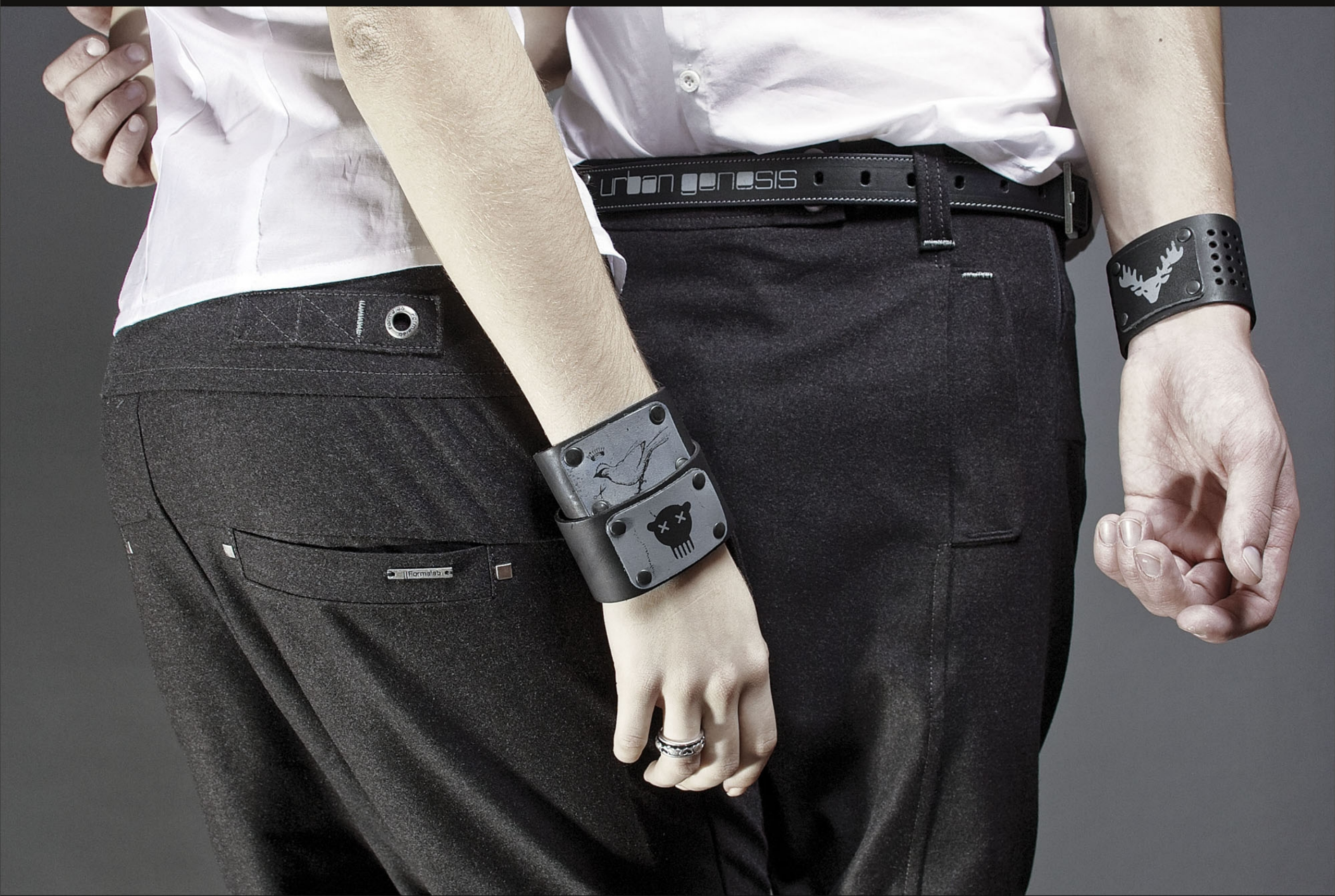
Брюки "Meds" Tapered Fit