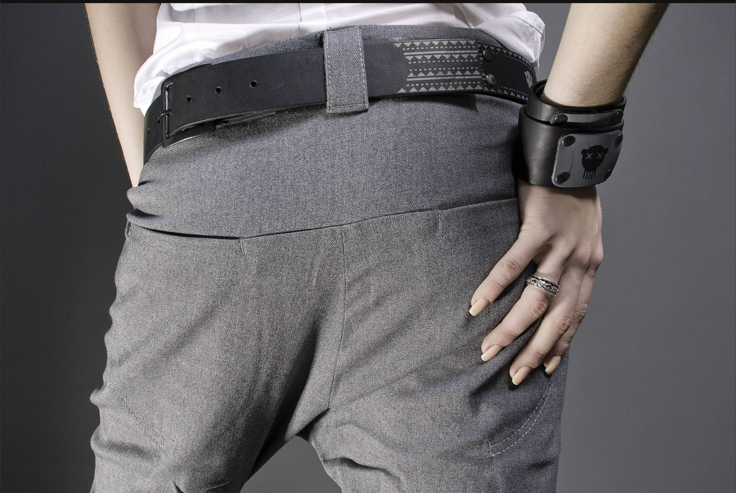
Брюки "Hold on" Tapered Fit