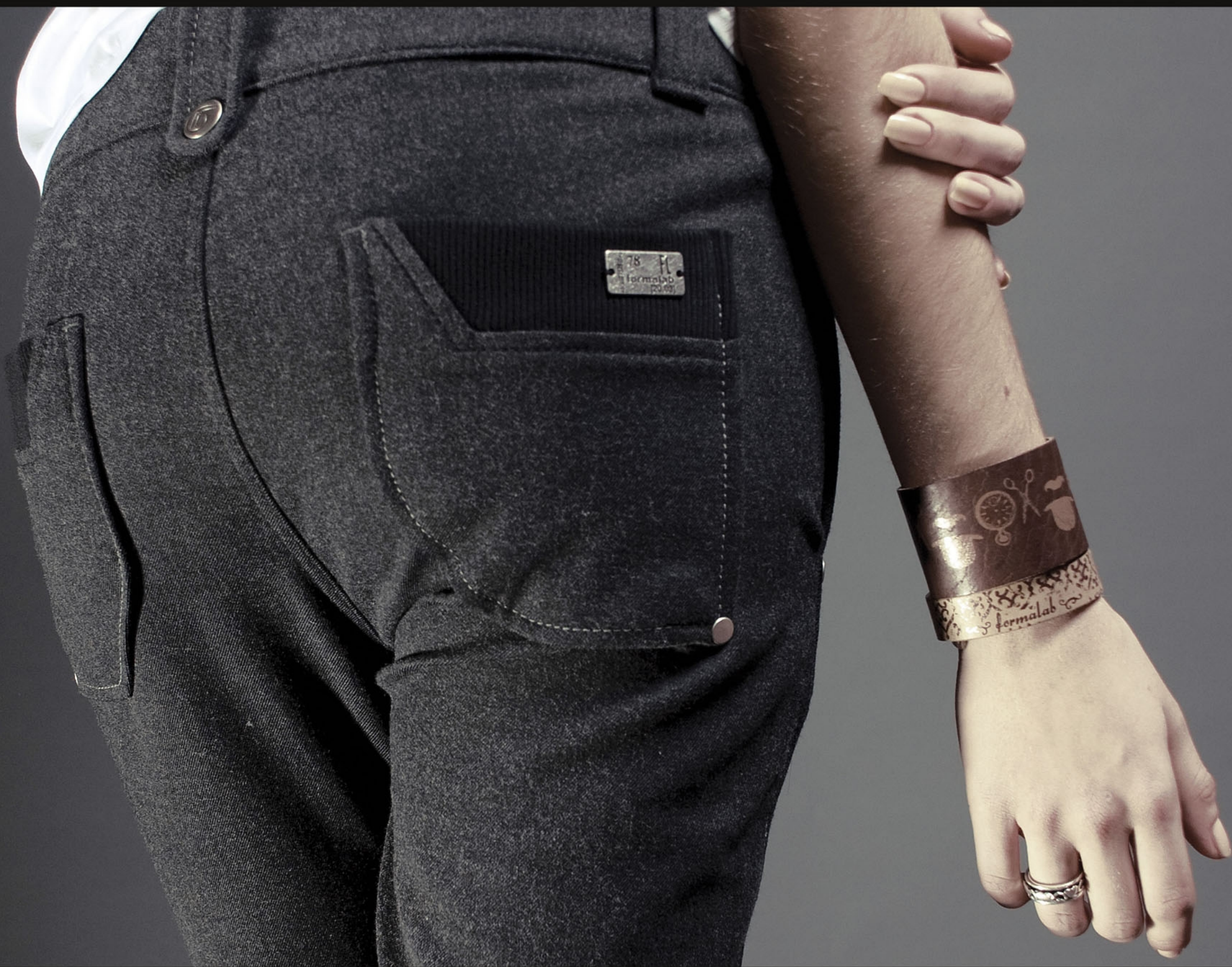
Брюки "Unisex" Loose Fit