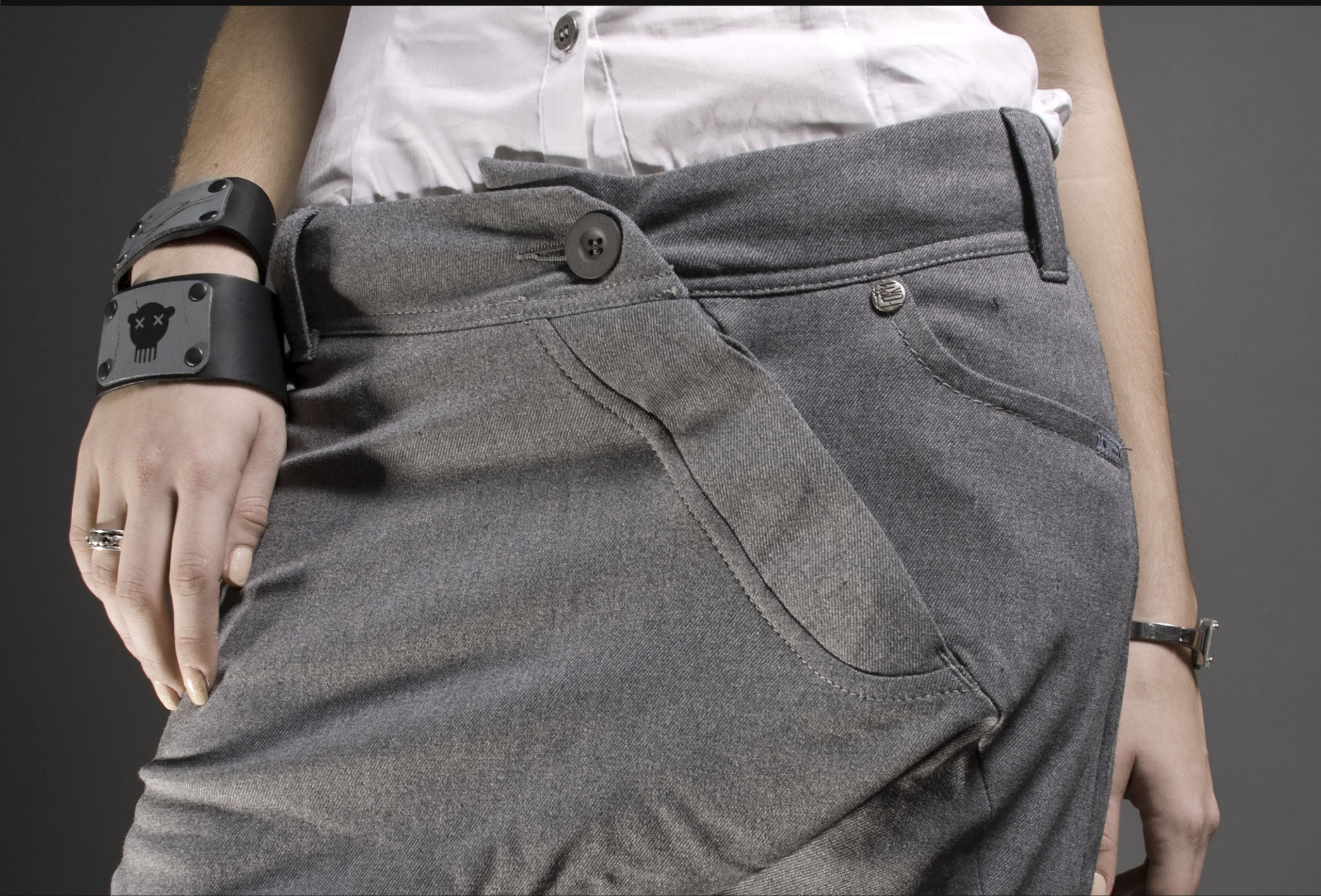
Брюки "Hold on" Tapered Fit