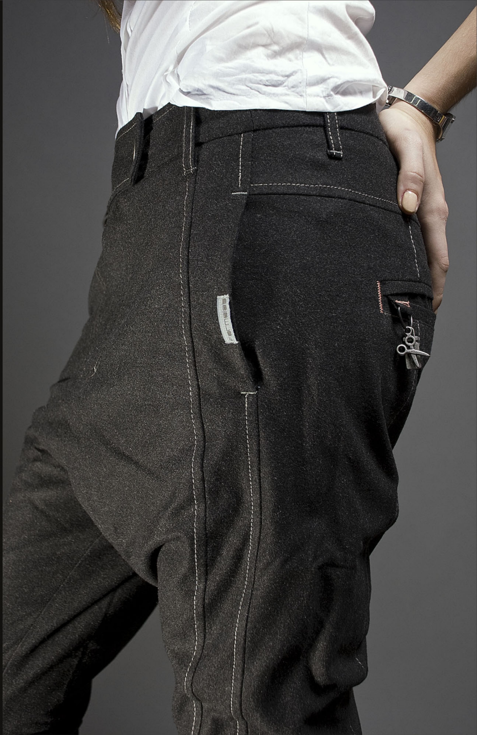
Брюки "Middle" Tapered Fit