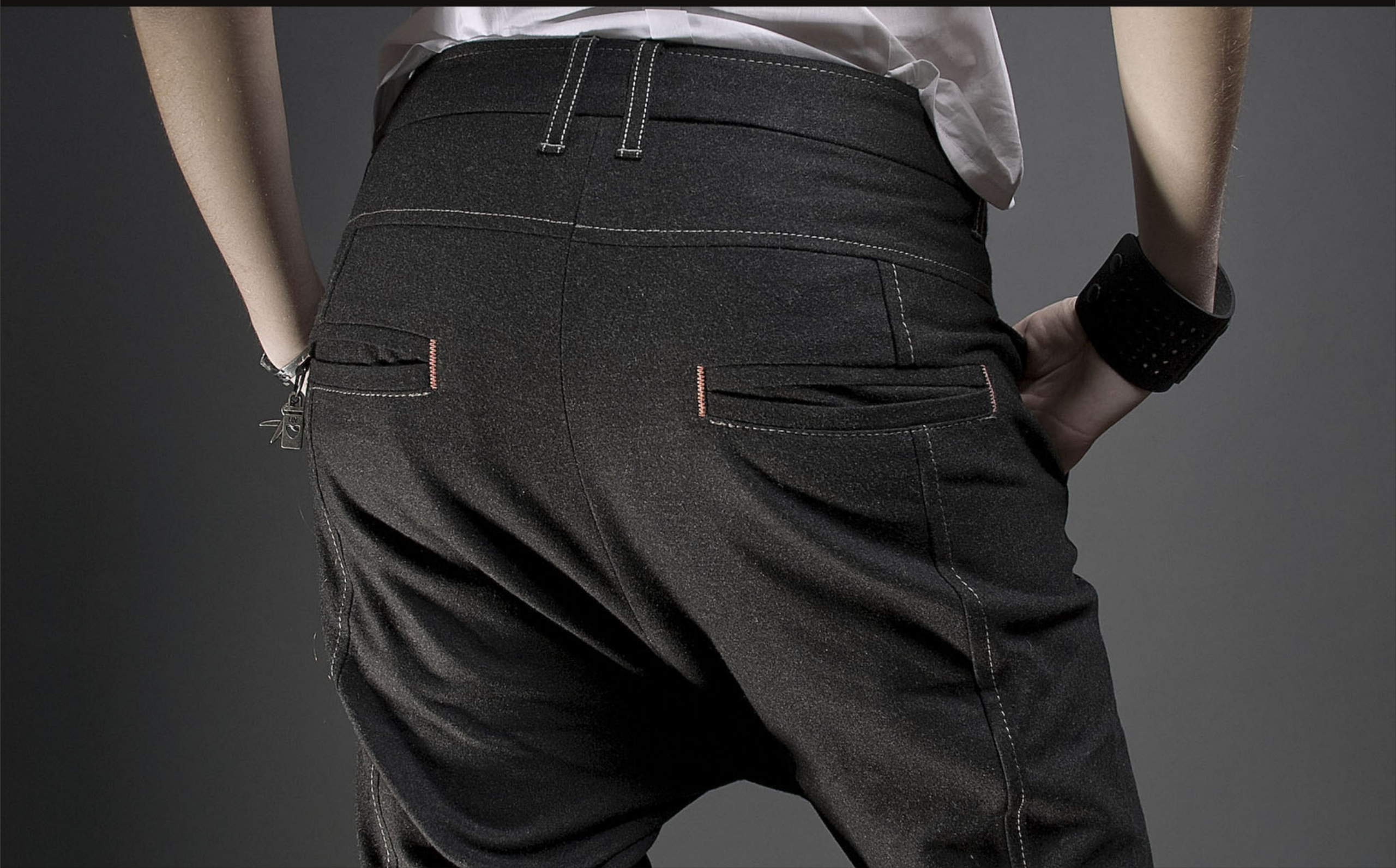
Брюки "Middle" Tapered Fit