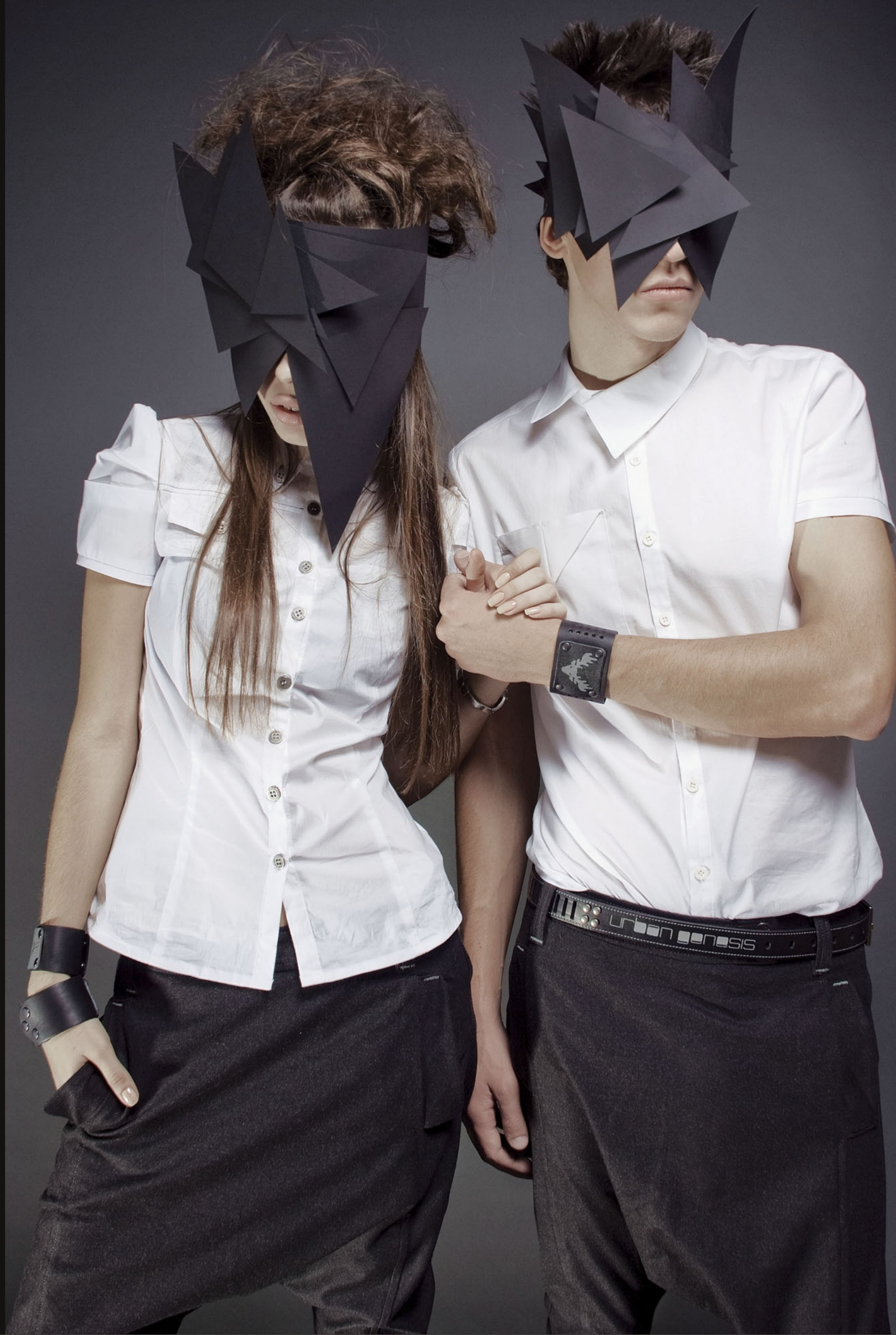
Брюки "Meds" Tapered Fit