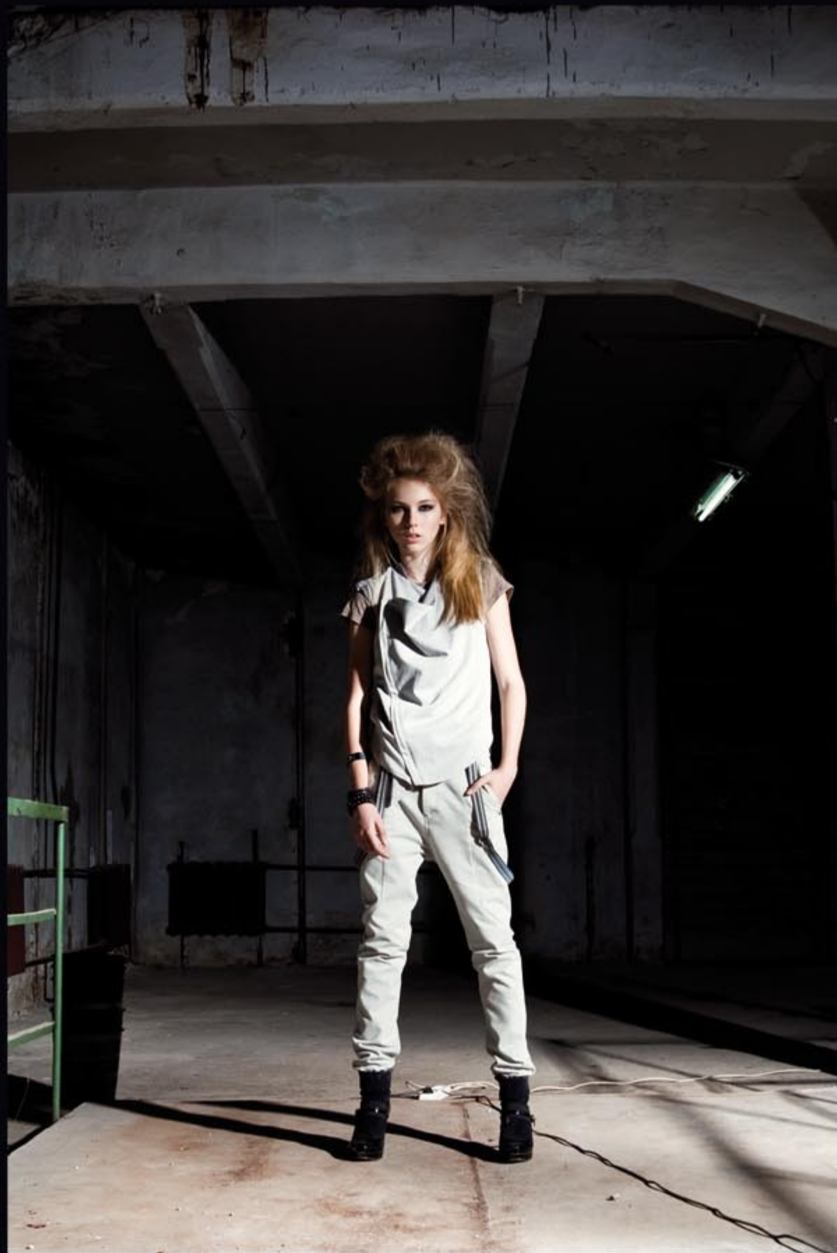
//////// 1. Брюки "Dot" 2. ///// Футболка "Conservation" 3. Жилет "Apollo" // // // // // 4. Напульсник "Blog" 5. Напульсник "Dekko"